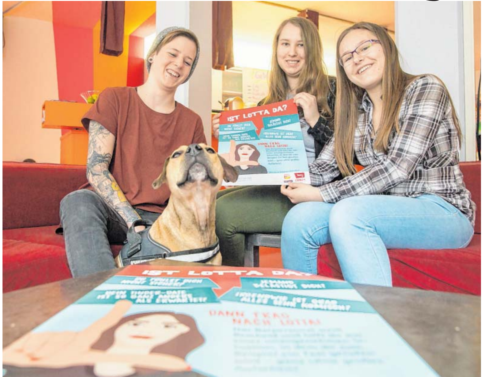
Im Mädchenzentrum Amazone haben junge Vorarlbergerinnen das „Lotta“-Plakat und Sticker für die Lokal-Eingangsbereiche gestaltet und auch den Namen „Lotta“ ausgesucht.